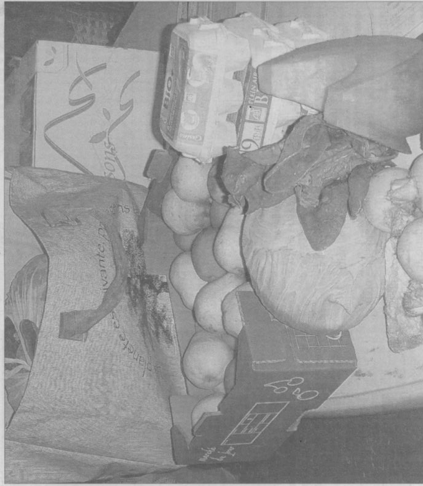
Un exemple de livraison de fruits, légumes, œufs et fromages.